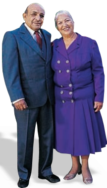
4. el abuelo