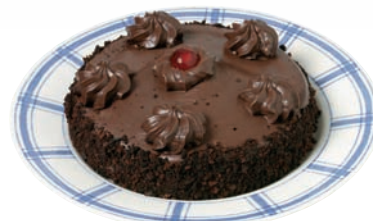
pastel / tarta / torta