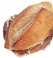
torta / bocadillo

In Mexico the word torta is used to describe a large sandwich on crusty bread. In Spain bocadillo is used. In other countries, torta usually means cake . In Mexico, the word pastel is used to mean cake . In Spain, tarta is used for cake .